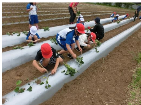
さつまいもの苗植え

週に3回、4校時終了後に設定している「モジュール」の時間は、児童が自分のよさを伸ばす時間とし、一人一人が課題を設定し、追究しています。例えば、ある、サッカーが好きな男子児童は「サッカーのリフティングがもっと上手になりたい」という願いから、「どのようにしたらリフティングがうまくなるのか」という問いを立て、調べたり、実際にボールを使って実演してみたりしながら、なぜうまくいかないのかを試行錯誤しています。その過程で多様な人、ものとの関りがあったり、自分のよさに気づいたりという経験ができるようにしたいと考えます。保護者や地域の方にご協力をお願いすることもあるかと思っておりますので、ご理解とご協力の程、よろしくお願いいたします。