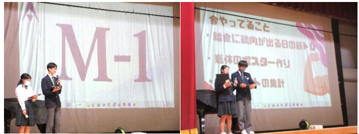
生徒会本部によるスローガン発表

さて、今回の生徒会本部や委員会の活動は「生徒会活動」という、国の定めた学習で、以下の目標があります(AIの要約)。