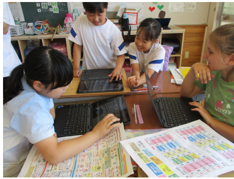
4年生 社会 ごみのしよりと利用