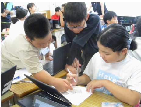
6年生 算数 円の面積

本校をめざす「安心と夢中のある学校」、「児童が夢中になって学ぶ姿」を実現するために、全職員で授業づくり研修会を行っています。今年度の授業づくりのポイントは、①「対話を生み出し、子どもが夢中になれる導入の工夫」、②「誰もが主役になれる対話の活性化と話し手・聞き手の目的の明確化」、③「ICT活用や振り返りの充実による質の高いアウトプットの場の設定」の3つです。6月15日（月）から7月3日（金）を今年度第1回目の「相互授業参観週間」とし、職員同士で授業を参観し合う場を設定しています。放課後は、その授業の授業者と参観した職員で対話を通したリフレクションを実施し、授業のよさや工夫点、改善点などについて積極的な話し合いを進めています。様々な意見が飛び交う様子は、まさに「安心と夢中」のある職員室。職員一人一人がスキルアップし、また、同僚性を大切に学び合うことで、チームとしての力も高めていきたいと考えています。職員同士の相互授業参観にあたっては、各クラスの児童の見守り等の安全管理にも配慮しながら実施いたします。今後も、子供たちが夢中になって学ぶような授業づくりのための研修を日々進めてまいります。