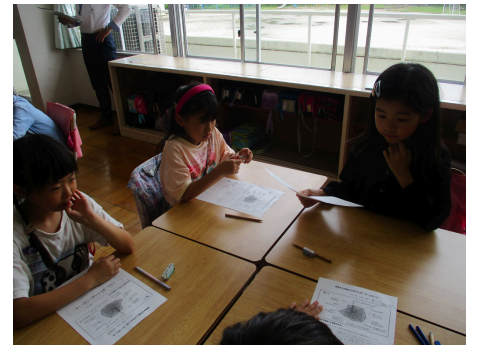
3年生 学活 学級力向上プロジェクト