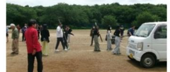
ありがとうございました。