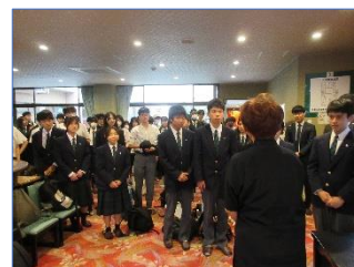
ますや旅館の女将さんに御礼