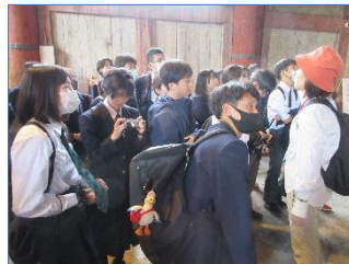
東大寺でのガイドさんの説明