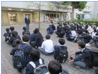
出発式の実行委員長挨拶

保護者の皆様には事前準備から当日早朝のご対応まで、大変お世話になりました。感謝申し上げます。