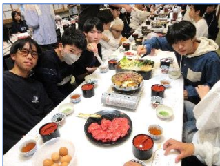
すき焼き! 牛肉に興奮!