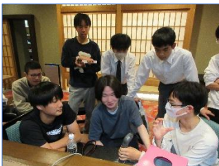
実行委員会企画で館内放送ラジオ