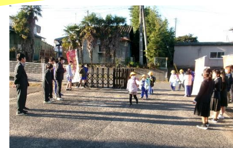
小中合同あいさつ運動