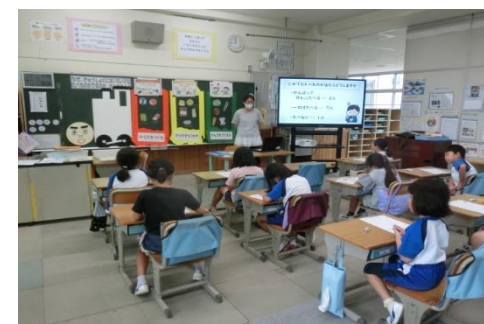
栄養教諭による食育指導