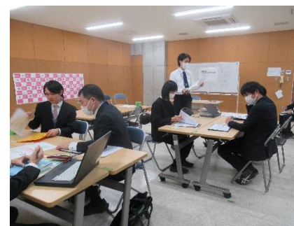
合同新規採用者研修会