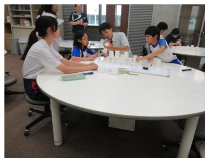
輝翔学園リーダー研修会