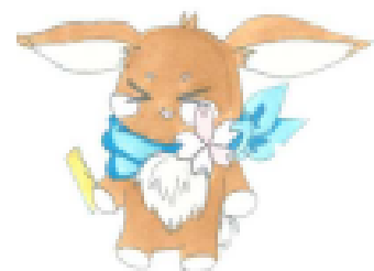
本校キャラクター：ませラッティ

※職員名を掲載しています。学校だよりは各ご家庭内のみでの閲覧をお願いいたします。