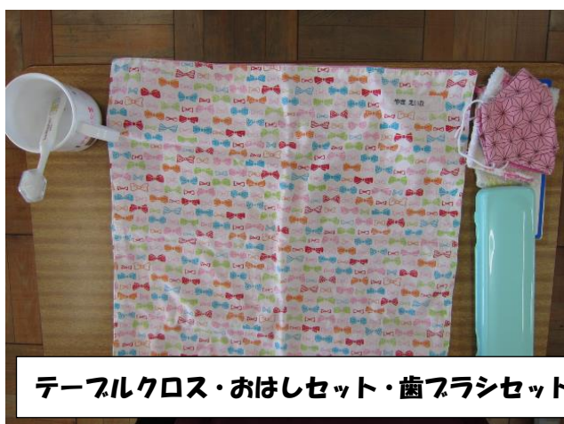
テーブルクロス・おはしセット・歯ブラシセット

床からフックまで 45cm 程度ですので、机の脇にかけた時に床につかないようにするためです。