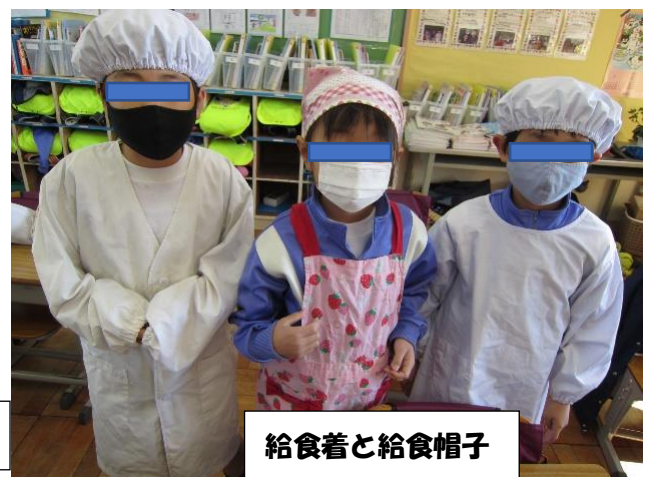
給食着と給食帽子