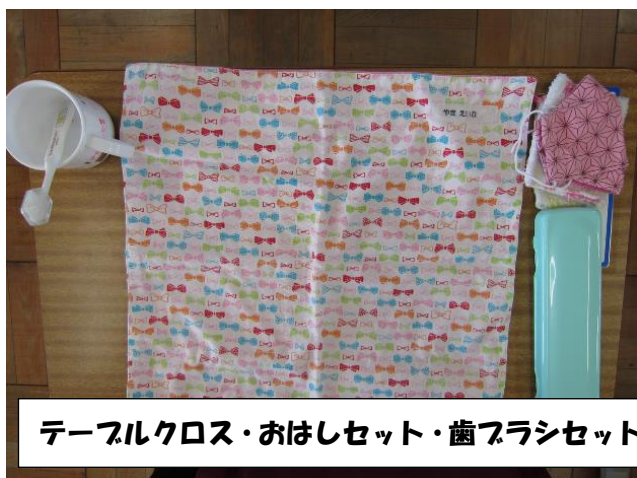
テーブルクロス・おはしセット・歯ブラシセット

床からフックまで 45cm 程度ですので、机の脇にかけた時に床につかないようにするためです。