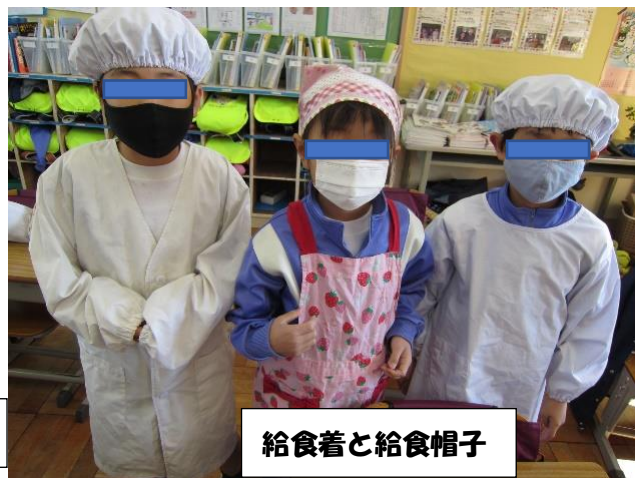
給食着と給食帽子