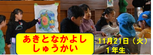
あきとなかよし しゅうかい