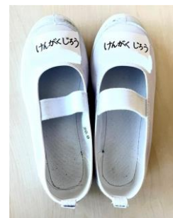
(例) 手提げと上履き入れ