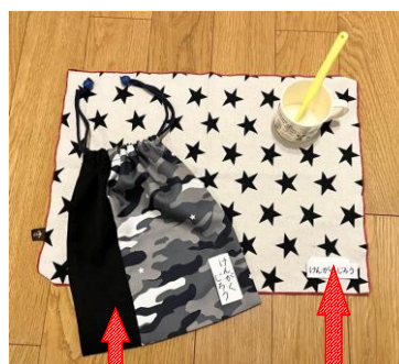
給食袋 テーブルクロス